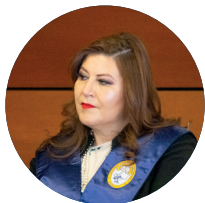
Por: Mónica Daza Ondarza Vicerrectora Académica Nacional