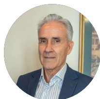
Por: Juan Carlos Requena Miembro Junta Directiva Nacional